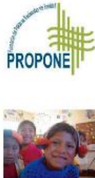
RED PROPONE: 'Promoción de Políticas Nacionales de Equidad' Argentina, Chile, Colombia y Perú

Red PROPONE – Promoción de Políticas Nacionales de Equidad en Educación es una iniciativa regional que se orienta a promover políticas educativas de equidad en educación desde experiencias innovadoras en la escuela. Compartimos con ustedes la primera política educativa sobre una Escuela que Promueve la Equidad, política que han elaborado, en el marco de un proyecto de incidencia, ocho instituciones de Chile, Argentina, Colombia y Perú, entre las cuales se encuentran el Instituto Peruano de Educación en Derechos Humanos y la Paz - IPEDEHP y la Asociación de Publicaciones Educativas – Tarea, afiliadas del CEAAL.