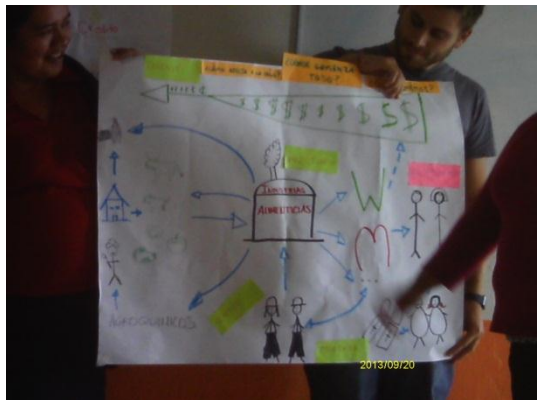
1.2. Papelografo realizado durante la actividad en donde se muestra la lógica de los circuitos económicos capitalistas y solidarios.

temática que era sobre el ciclo de producción y los circuitos económicos en donde analizamos dos videos que trataban sobre la lógica de la alimentación bajo dos vertientes, una capitalista y otra solidaria. El primer video que nos fue proyectado fue un breve resumen del que habíamos visto la noche anterior sobre McDonald's 8 y el segundo llevaba el nombre de la mata a la olla 9 . Realizamos equipos de dos a tres parejas para conformar pequeños conversatorios en los que plasmamos nuestras reflexiones y percepciones al ver los dos videos para posteriormente aterrizarlos en el video que nos